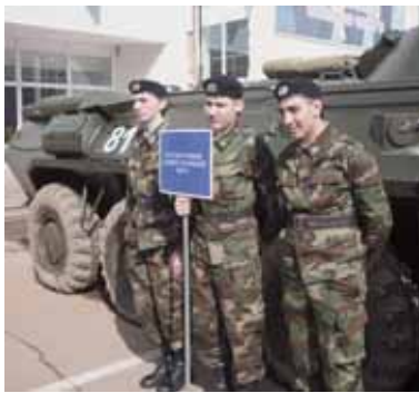
матрос, сержант или старшина, проходящий военную службу по

В военном комиссариате города Москвы по Лефортовскому району ЮВАО проводится работа по подготовке к призыву граждан на военную службу. Подготовка к призыву включает в себя отбор и направление граждан, подлежащих призыву на военную службу, для обучения по военно-учетным специальностям (ВУС). Солдат,