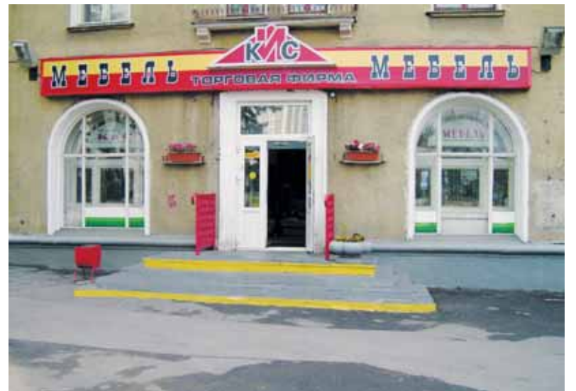
● ООО КИС – стало