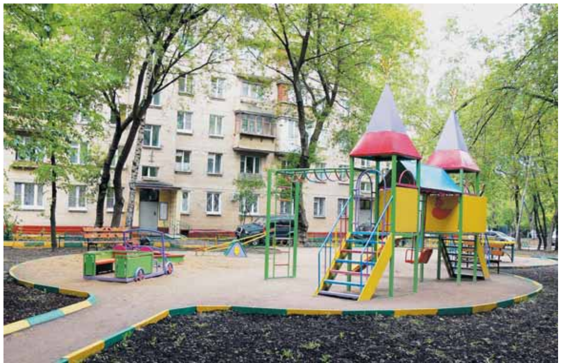
● Двор дома 8 по ул. 1-я Текстильщико́в

К 1 сентября 2011 года будет отремонтировано 100% площадок.