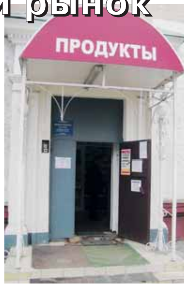
● ООО Елисей и К° – было

Так же, в соответствии с программой комплексного благоустройства, на 5 предприятиях промышленности ведутся благоустроительные работы. Срок сдачи объектов 15.08.2011г.