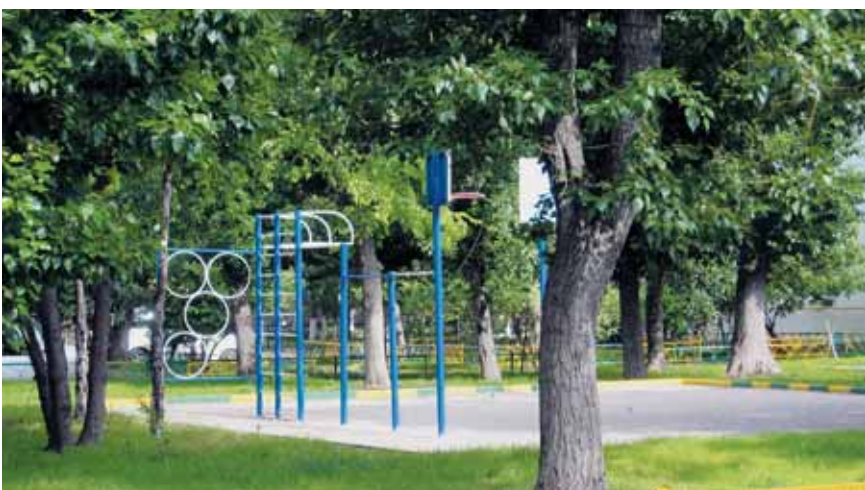
● Двор домов 13 и 13А по ул. 7-я Текстильщико́в

В 2011 году будут благоустроены все дворы района. Объем финансирования по благоустройству дворовых территорий составил 81 млн. руб. Объем финансирования по ремонту подъездов составил 27,5 млн. руб.