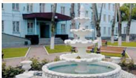
Здесь учатся воспитанницы кадетской школы-интерната №9

Всего в учреждения образования района Текстильщики в 2011 году на благоустройство территории, капитальный ремонт и текущий ремонт направлено 63145,84 тыс. руб.