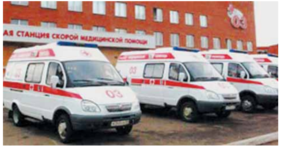
● Готовы к вызову