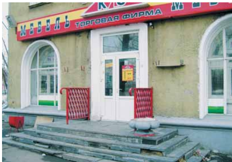
● ООО КИС – было