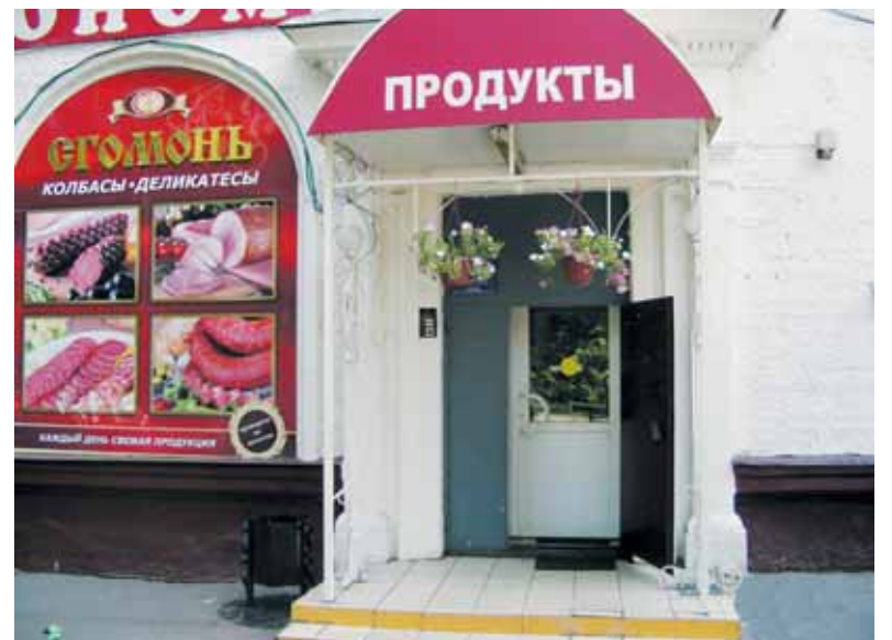
● ООО Елисей и К° – стало