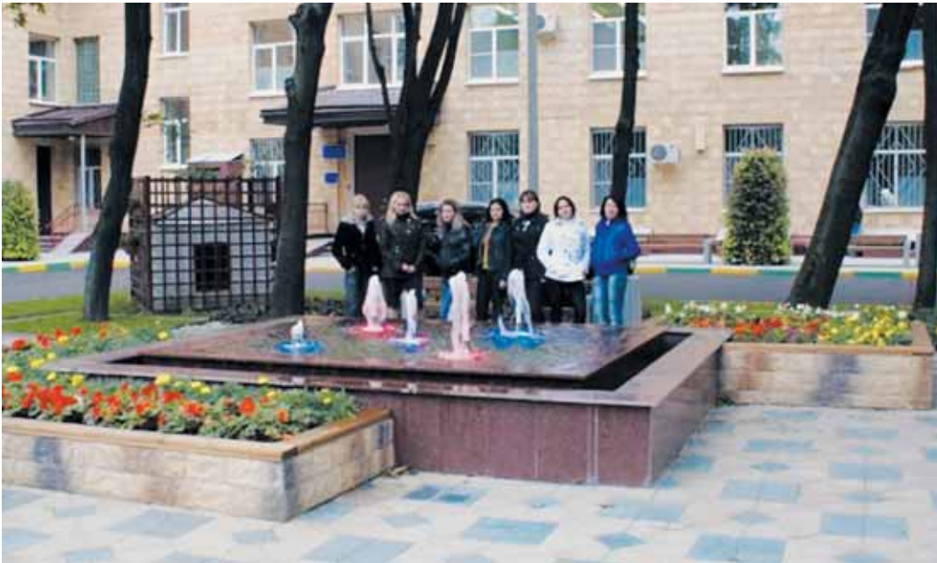
● Городская клиническая больница №68

В 2011 году во всех 9 учреждениях здравоохранения будут проведены ремонтные работы.