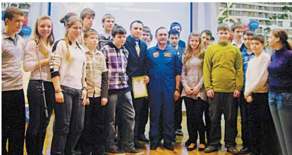
● С космонавтом хотели сфотографироваться буквально все

– МКС сегодня объединяет 26 стран – это самый большой международный проект, который когда-либо вообще осуществлялся на Земле, поэтому мы гордимся, что сегодняшняя МКС, объединяющая Америку, Европу, Японию, началась именно с наших российских модулей. Сегодня станция достигла громадных размеров: 240 метров в длину, 200 метров в ширину, а