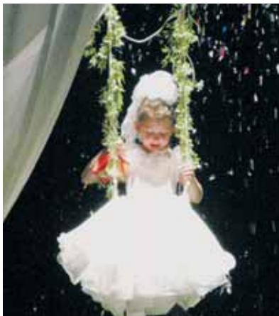
● Последний звонок-2010

– Считаю, что критерий один – мнение выпускников и их родителей. Большинство нынешних школьников спрашивать бессмысленно. Объективность оценок школы должна немного отстояться после выпуска. У большинства наших выпускников остается теплое чувство к школе не только из-за успешного поступления в вуз, но и за