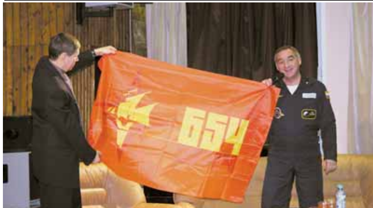
Теперь на флаге есть печать МКС