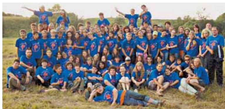
● Школьный лагерь Бригантинск

ющему красивые, вкусные и полезные плоды. Деревья бывают разные: повыше и пониже, постарше и помоложе, разных размеров. Выбор, однако, очевиден. Вот и все «критерии».