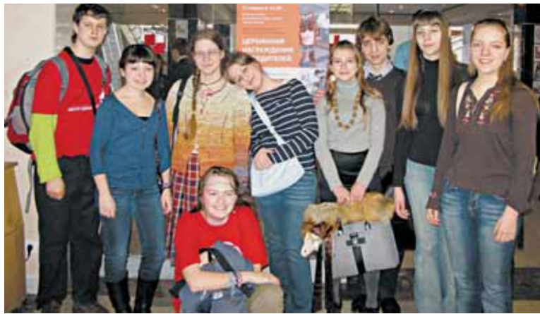
● Журналисты школьной газеты – призеры конкурса школьных изданий России – на церемонии награждения в Департаменте образования

В начале месяца на сайте Департамента образования города Москвы был опубликован «Список московских школ, стабильно обеспечивающих высокий уровень образования». Проще говоря, список лучших школ Москвы. В него вошло около трехсот учебных заведений, то есть лишь примерно пятая часть от общего количества общеобразовательных учреждений нашего города.