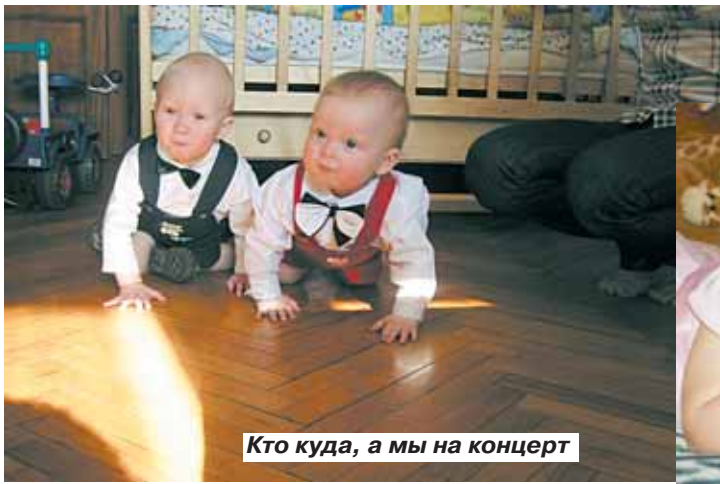
Кто куда, а мы на концерт

А посмотреть выставку фоторабот можно в библиотеке №80 (ул. 8-я Текстильщицкая, д.14, тел. 8-499-178-57-79).