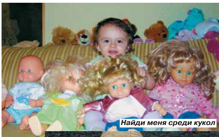
Найди меня среди кукол