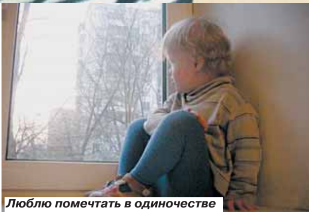
Люблю помечтать в одиночестве

Подробная информация о фотоконкурсе – на сайте управы района http://tekstilshchiki.ru в разделе «Пресс-центр».