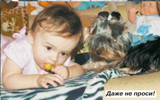
Даже не проси!