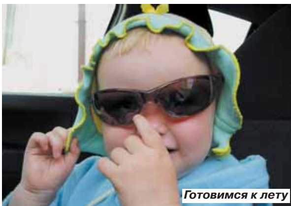
Готовимся к лету