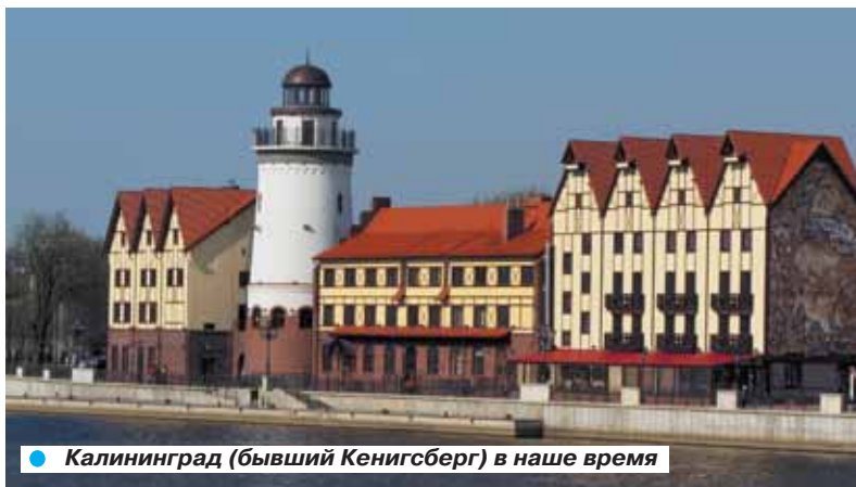
● Калининград (бывший Кенигсберг) в наше время

нигсберге всю войну работали подземные военные заводы, здесь был сосредоточен огромный арсенал боевой техники. Кроме того, в центре города находилась цитадель. Вокруг города-крепости тянулись три мощные линии обороны.