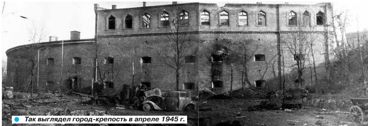
● Так выглядел город-крепость в апреле 1945 г.

Фашистское командование приняло все меры, чтобы подготовить их к длительной осаде. В Ке-